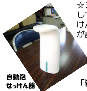
自動泡せっけん器