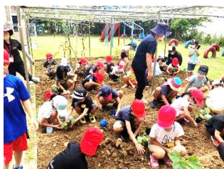
2年・野菜植え付けの様子

「あいさついっぱい・花いっぱい・読書いっぱい」そして、子ども達の「笑顔いっぱい」の高嶺小学校となるよう、これからも職員一同、頑張りたいと思いますので、よろしく願いいたします。